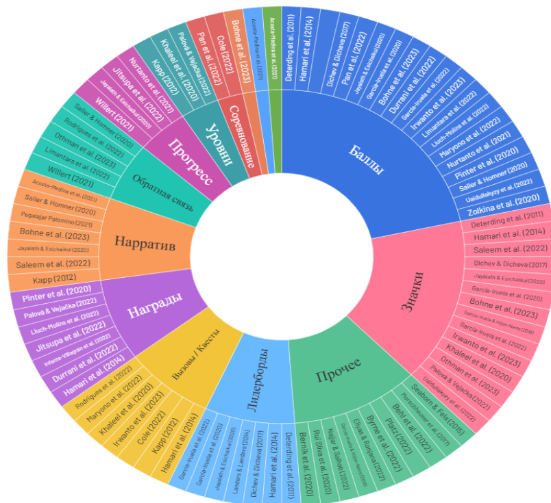
Рисунок 3. Наиболее распространённые элементы геймификации в высшем образовании (2020–2025) (составлено авторами)

В целом структура визуализации демонстрирует преобладание традиционных элементов (баллы, значки, рейтинги) и постепенное расширение интереса к более коллаборативным и поддерживающим игровым стратегиям, что отражает сдвиг исследовательского фокуса в последние годы.